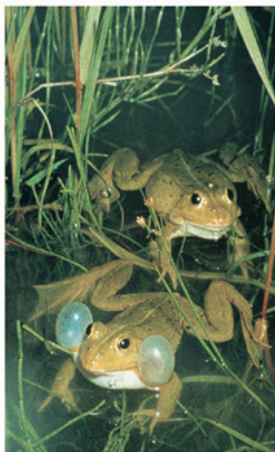
Wasserfrosch - Rana verde

◆ Il lago di Varna giace in una conca di materiale morenico argilloso. Viene alimentato da un rigagnolo sorgivo, è privo di deflusso e profondo al massimo 2,2 metri. Lo scarso ricambio all'acqua e l'intensa balneazione uniti alle immissioni dell'ambiente circostante provocano eutrofizzazione e moltiplicazione delle alghe. Solo grazie a costose misure di risanamento come lo sfalcio delle piante acquatiche, l'aspirazione del fondo melmoso, la parziale dragatura del canneto e l'apporto di acqua pulita si è potuto salvare questo frequentato gioiello della natura.