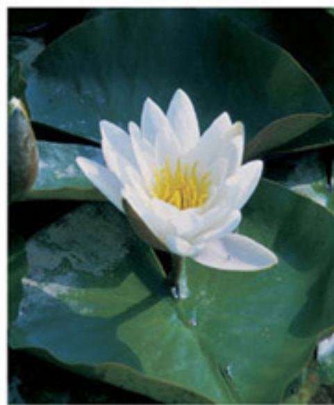
Weißer Seerosen - Nymphaea

◆ Der Vahrner See liegt in einer von lehmigem Moränenmaterial abgedichteten, abflusslosen Mulde. Er wird von einem kleinen Quellbach gespeist und ist maximal 2,2 Meter tief. Der geringe Wasseraustausch, der rege Badebetrieb und Belastungen aus der Umgebung verursachen eine Nährstoffanreicherung und starkes Algenwachstum. Nur durch kostspielige Sanierungsmaßnahmen wie Mähen der Wasserpflanzen, Absaugen des Faulschlammes, teilweises Ausbaggern des Schilfmoors und Frischwasserzuleitung konnte dieses beliebte Landschaftsjuwel gerettet werden.