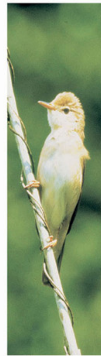
Sumpfroschsänger Cannaiole verdognola