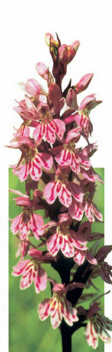
Fuchs-Knabenkraut Orchidea di Fuchs