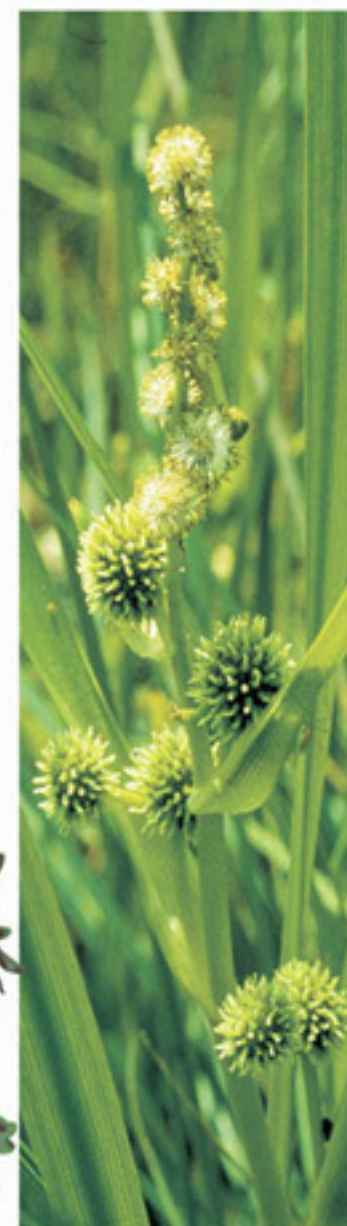
Astiger Igelkolben Cottellaccio maggiore