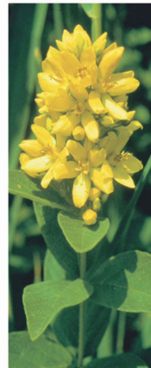
Gemeiner Gilbweiderich Mazza d'oro comune